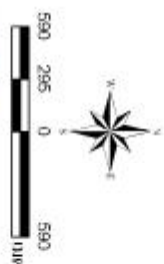
รูปที่ 3-3 แผนที่การใช้ที่ดิน แบ่งเขต อำเภอป่าท้อ จังหวัดนครปฐม